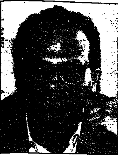
جمال الفيطاني (القدس العربي)

القاهرة - رويترز: قال الروائي جمال الفيطاني الذي يرأس لجنة العلاقات العربية في اتحاد الكتاب المصريين أن من مقامة ما يشغل الاتحاد وحمل الجسور مع الحركة الثقافية العربية والدفاع عن حرية التعبير والابداع.